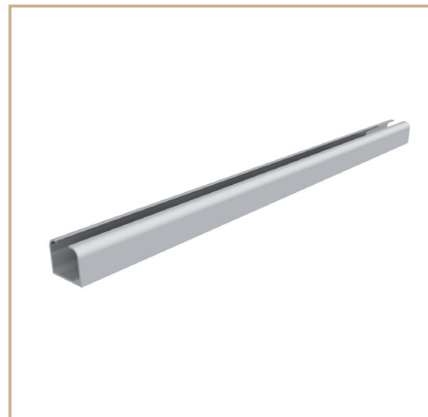
FÄSTNING PROFIL ALUMINIUM