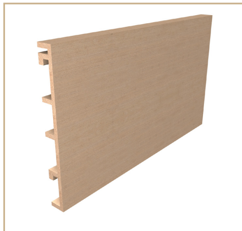
VÄGGBEKLÄDNAD 300x33 - FRAM-