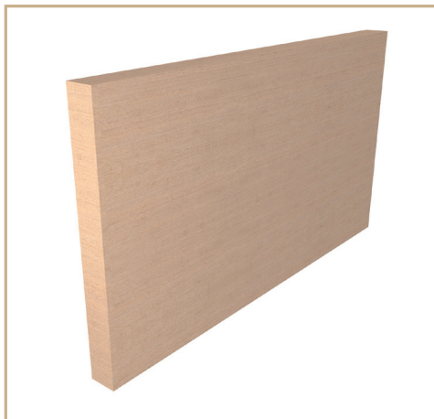
VÄGGBEKLÄDNAD Avslut Vänster