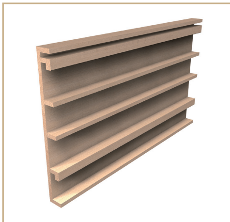
VÄGGBEKLÄDNAD 300x33 - BAKSIDA